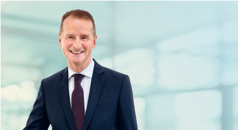
Dr.-Ing. Herbert Diess

Vorstandsvorsitzender der Volkswagen Aktiengesellschaft und Vorsitzender des Markenvorstands Volkswagen Pkw, Markengruppe Volumen, China