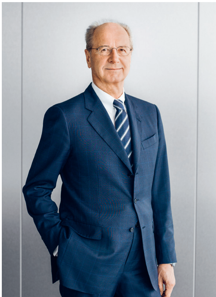
Hans Dieter Pötsch

Im Mittelpunkt der Aufsichtsratssitzung am 12. April 2018 stand die Weiterentwicklung der Führungsstruktur des Volkswagen Konzerns. In diesem Zusammenhang beschlossen wir auch personelle Änderungen im Vorstand der Volkswagen AG. Des Weiteren befassten wir uns mit der strategischen Ausrichtung der Volkswagen Truck & Bus GmbH (jetzt TRATON SE) und diskutierten den aktuellen Sachstand zur Dieselmaterie.