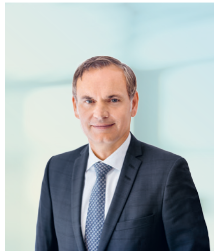
Oliver Blume Vorstandsvorsitzender der Dr. Ing. h.c. F. Porsche AG, Markengruppe Sport & Luxury